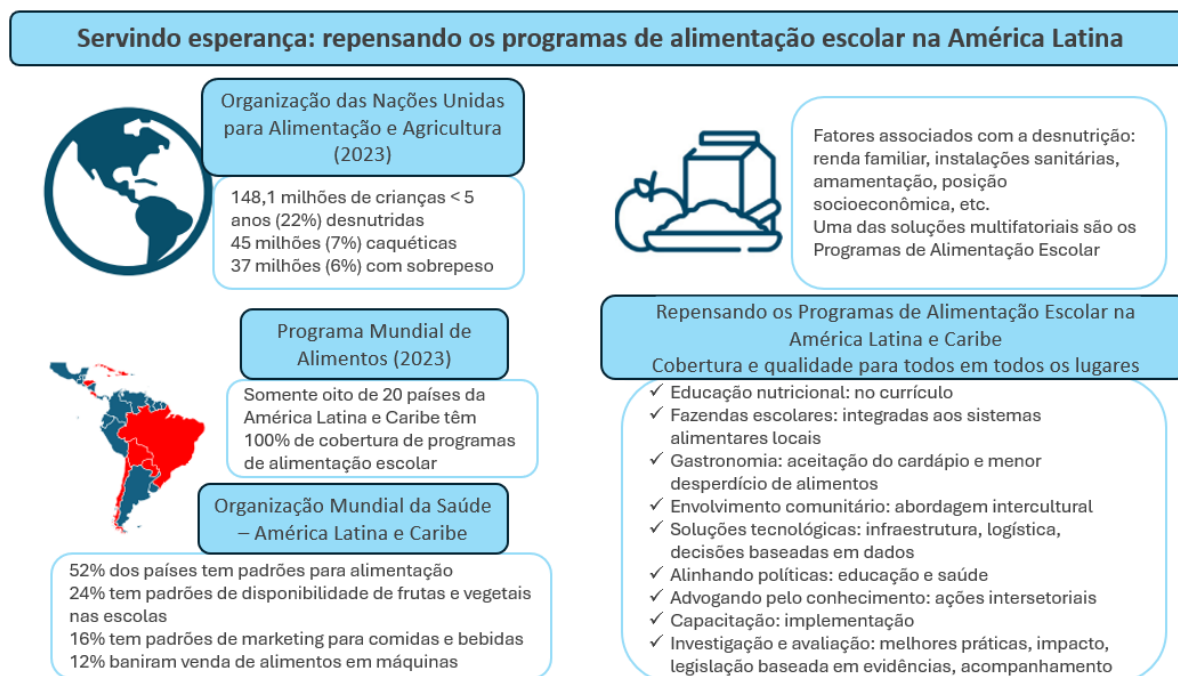
Figura 1: Programas de alimentação escolar na América Latina e Caribe